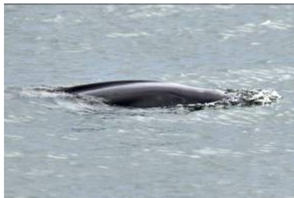
現われたスナメリ

すぐに目に入ったのがオオミズナギドリでした。その名の通り波をかぶりそうな低空をスイスイ飛んでいます。その上にはおなじみのウミネコ。やや遠くでカモの仲間であるスズガモの群れがうねりの上で休んでいました。30羽くらいの群れです。いつもよりオオミズナギドリが堤防の近くまで来てくれます。