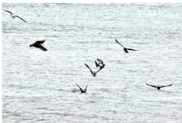
スナメリの居場所教えてくれるウミネコ

スナメリはクジラの仲間で、全長は1.8m前後。背ビレが無いことが特徴です。そしてこの日ラッキーだったのはこの光景がしばらく続いたことでした。そして私からたった20mくらいの距離まで来てくれます。現れては消え、また現れる。その居場所を鳥たちが教えてくれる。こんなに水が濁っていて