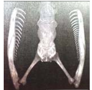
図4. 右利きヘビは左右歯の数が違った

きのヘビ仮説」細将貴著(東海大学出版会)、追うヘビ、逃げるカタツムリの右と左の共進化をご覧ください(図3, 4は著書より引用させて頂きました)。