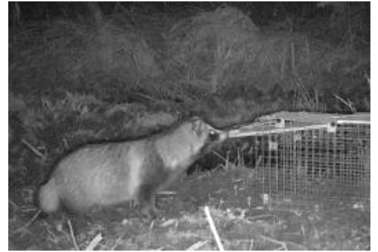
赤外線カメラで撮影したタヌキ(2020年12月21日)