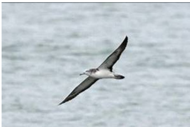
オオミズナギドリは水平線の下を飛ぶ

レンズを向けて夢中でシャッターを切ります。至福の時です。そのうちにウミネコ数羽が急降下、争うように着水します。そしてすぐに飛び立ちます。しばらくすると違う場所で同じ光景が。さすがに異変に気付きました。海の中に何かがいるようです。瞬時にスナメリが頭をよぎりました。いすみ市の方にはスナメリが出る話を聞いていたので。しかし水が濁っていて何も見えません。それでも犯人をウミネコが教えてくれました。急降下したすぐそばに現れたのです。背ビレが見えませんが。スナメリと確信しました。