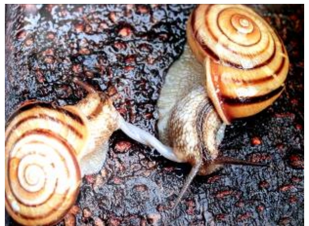
図2. 右巻同士の交尾

右巻の種類に、もし一匹の左巻カタツムリが生まれたら、その一匹は恋が成就しないことがわかりました。そんな逆巻きカタツムリの切ない恋の結末は……。カタツムリは雌雄同体で首のあたりに、オス・メスの両方の生殖器を持っています。それで、二匹が互いに精子を交換し合って、それぞれが卵を産みます。生殖器の位置は、右巻のカタツムリでは首の右側。二匹が向かい合って、握手をするように交尾をします(図2)。