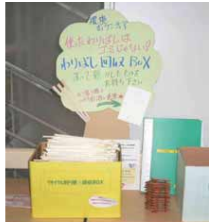
若葉区ボランティアセンターの様子

飲食店や団体などで大量にリサイクルされる場合は、 受け入れ事業所(千葉市中央区末広町)を紹介し、そちらに 直接届けてもらっています。