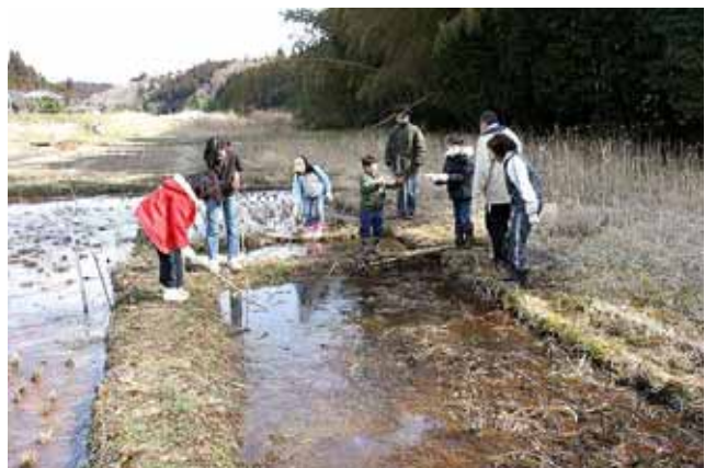
みんなの田んぼでアカガエルの卵を観察

暖冬の今季にしては珍しく冷え込んであちこちに背の高い霜柱が立ち、田んぼにはしっかりと氷が張っていました。今年のニホンアカガエルの産卵は2月10日ごろからはじまり、最初の頃にほとんどが産み付けられたようですが、その後も産卵は続いているようで産んだばかりの卵塊も見られました。氷の下の卵をみんなでじっくり観察すると孵化しているものもあり、まだ生まれたばかりのようで、黒い棒のようなオタマジャクシが動かずじっとしていました。ふるえ上がるような冷たい風がふいていましたが、子どもたちは元気いっぱい霜柱を踏みつけたり、竹で氷を割ったり。望遠鏡でツグミやモズ、ビンズイなど鳥たちの様子の観察もしました。