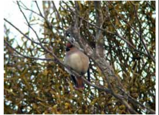
今年も飛来したヒレンジャク(2月17日板倉; 高山)