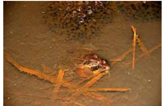
産卵に現れたニホンアカガエル(2月10日23:50 小山、高山)