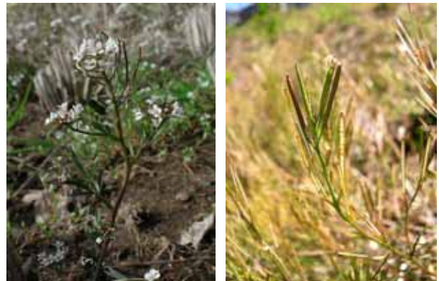
タネツケバナの花とたね