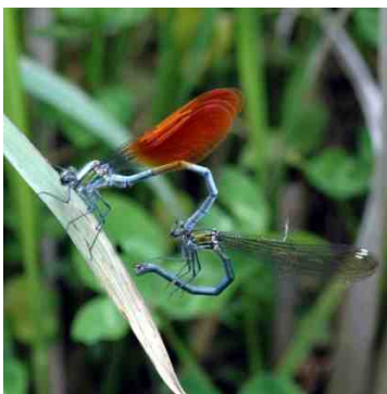
産卵直前のカワトンボ