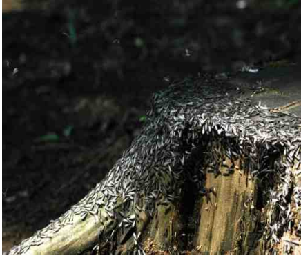
切り株に群がるヤマトシロアリ

5月9日は好天に恵まれウグイスのさえずりやシュレーゲルアオガエルの鳴き声も聞こえて絶好の「田起こし」日和となりました。雑木林の中では切り株から空に向かって優雅に飛び立って行く羽アリ（シロアリ）の大群や林床のさまざまな可憐な花も観察できました。