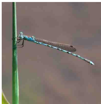
ホソミオツネトンボ