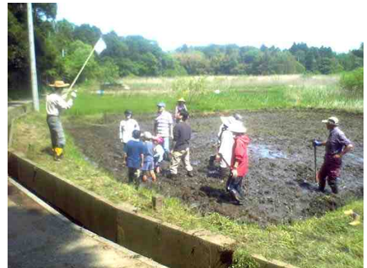
谷津田運動会「花咲かじいさん」

作業が一段落して谷津田を眺めると爽やかな5月の風が心地良く、とてもリラックスした気分になりました。