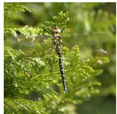
サラサヤンマ