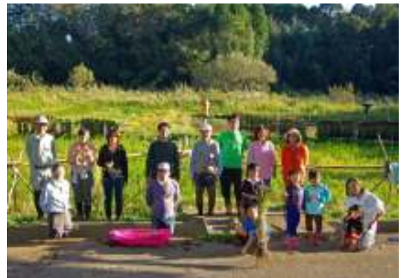
最後に記念撮影

台風 27 号の影響で 1 日延期になった古代米の稲刈り。晴天にはなりませんが、雨の影響で田んぼは水位が高く膝上まである深田用の長靴でないと入れない状態でした。緑米は育ちも良く作業のし甲斐もたっぷり。刈り残し、束ね残しが出ましたが 28 日には全部終了しました。用意したおだは隙間なくびっしり稲束が掛けられました。今年はスズメの群れが来て隣のマイ田んぼで育てた 10 種類の種籾用稲と丸い田の緑米はすっかり食べられてしまいましたが YPP 田んぼは 3 体のかかしのおかげでしょうか、無事でした。干している間に食べられないように鳥除けテープを張って終了しました。山はドングリが豊作でいっぱい落ちています。こども達はドングリを集めたり遊びに夢中でした。大人もドングリを集めて山の上の広場に蒔きました。