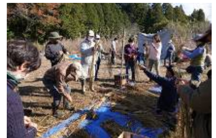
正月飾り作り実演講座

年齢 1 歳で 2 m スタートラインを下げるハンディ設定なので、6 歳児の後方 8 m にその後金銀を取る 10 歳は立ちました。いつもより大きいボートを水路に一斉に落とし、竹の棒でたたき 150 m 先のゴールを目指すものです。魔の水の三叉路までは接戦だったが、ここで差がついた。銀銅が至近距離で争うので、速度が落ちるが、抜けたそうた君は銀にじゃまされずにマイペースでたたき続けた。3 日前の一日中の大雨でこの水路の水量が多かったのも、4 分 50 秒の世界新記録の誕生に寄与しました。また楽しい谷津田運動会をやりようと思いました。