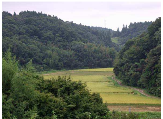
谷津田に水をもたらす山々

それでも、谷津田にたくさんいるあの絶滅危惧種の二ホンアカガエルは、冬場に産卵するため、冬でも水が